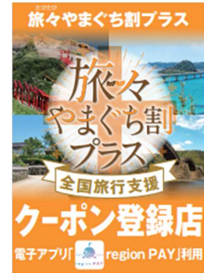
登録店ステッカー